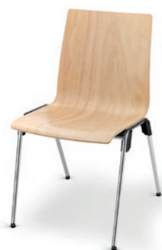
Modell 4010: Buche natur, ungepolstert