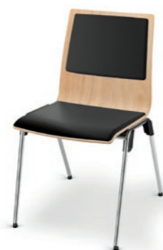
Modell 4012: Buche natur, Sitz- und Rückenpolster