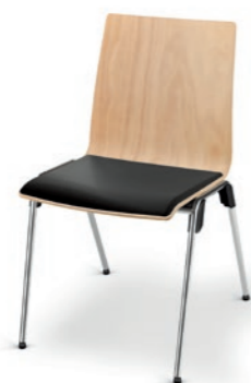
Modell 4011: Buche natur, Sitzpolster