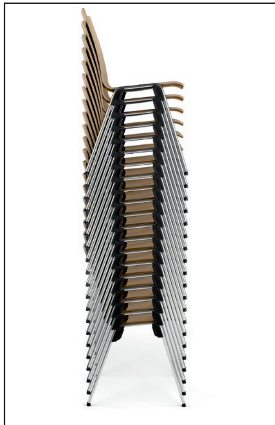
Modell 4010 Stapel