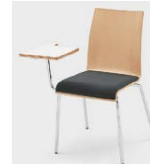
Modell 3011: mit Schreibtisch