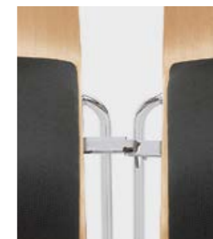
Modell 3031: Buche natur, Sitzpolster, mit Schiebe- Reihenverbindung Nr. 2