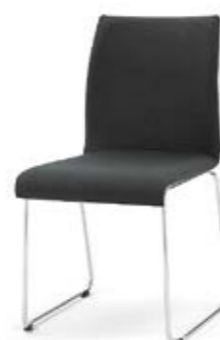
Modell 3034: Vollpolster