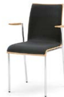
Modell 3023/A: Polsterdoppel, Armlehnen Buche natur