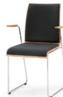
Modell 3032/A: Buche natur, Sitz- und Rückenpolster, mit Armlehnen Buche natur