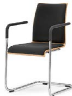
Modell 3042/A: Buche natur, Sitz- und Rückenpolster