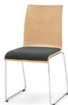
Modell 3031: Buche natur, Sitzpolster