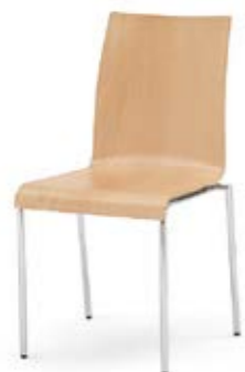
Modell 3020: Buche natur, ungepolstert