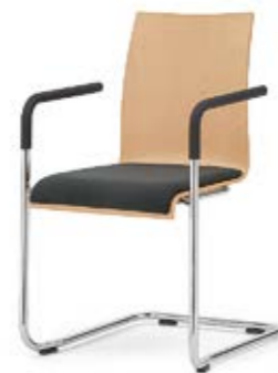
Modell 3041/A: Buche natur, Sitzpolster