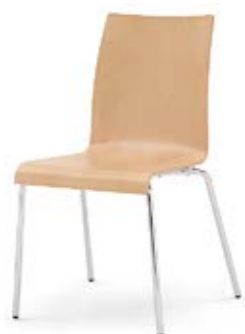
Modell 3010: Buche natur, ungepolstert