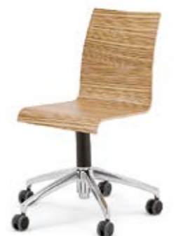
Modell 3050: Drehstuhl mit Aluminiumfußkreuz poliert