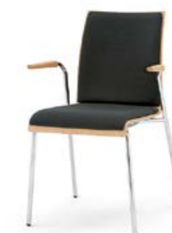
Modell 3012/A: Buche natur, Sitz- und Rückenpolster, Armlehnen Buche natur