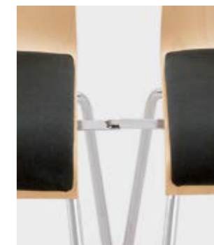
Modell 3011: Buche natur, Sitzpolster, mit Schiebe-Reihenverbindung Nr. 2