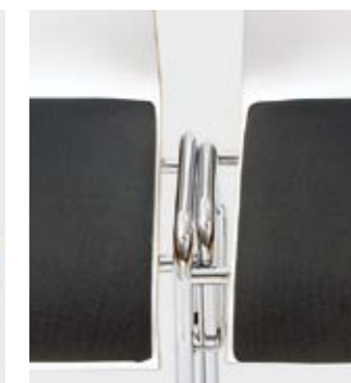
Detail: Integrierte Reihenver- bindung