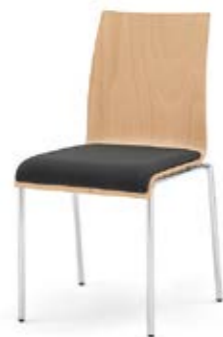
Modell 3021: Buche natur, Sitzpolster