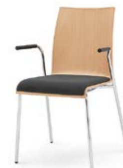
Modell 3011/A: Buche natur, Sitzpolster, Armlehnen mit Soft-Grip-Schlauch