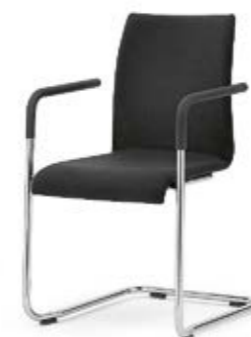
Modell 3044/A: Vollpolster