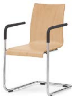
Modell 3040/A: Buche natur, ungepolstert