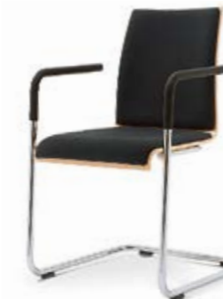
Modell 3042-NS/A: Buche natur, Sitz- und Rückenpolster, nicht stapelbar