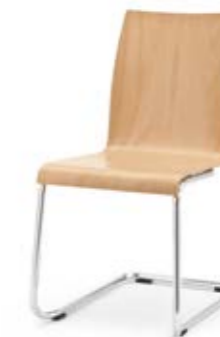
Modell 3040: Buche natur, ungepolstert