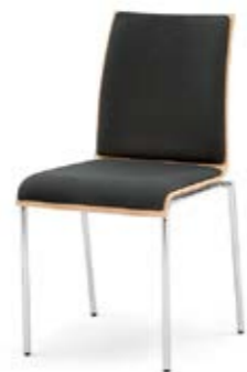
Modell 3022: Buche natur, Sitz- und Rückenpolster