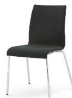
Modell 3014: Vollpolster