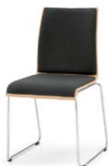
Modell 3032: Buche natur, Sitz- und Rückenpolster