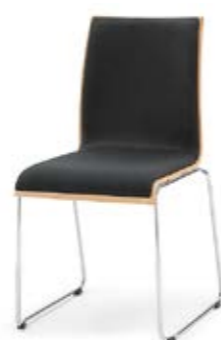
Modell 3033: Buche natur, Polsterdoppel