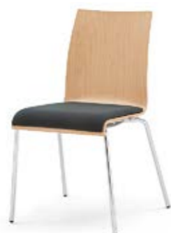
Modell 3011: Buche natur, Sitzpolster