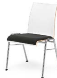
Modell 3091-1: Sitzschale Buchenschichtholz weiß laminiert, Sitzpolster

Modell 3060: Barhocker mit niedriger Rückenlehne Modell 3070: Barhocker mit hoher Rückenlehne Modell 3039: Bartisch