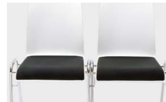
Modell 3091-2: Gestell mit integrierter Reihenver- bindung

Modell 3091-6: Stühle in Bankformation mit integrierter Reihenverbindung. Gestell: Rundrohr Ø 20 x 1,5 mm, verchromt, Sitzschale aus Buchenschichtholz natur lackiert, gebeizt, mit Edel-Deckfurnier oder mit Laminat in verschiedenen Farben, Polster in verschiedenen Ausführungen erhältlich.