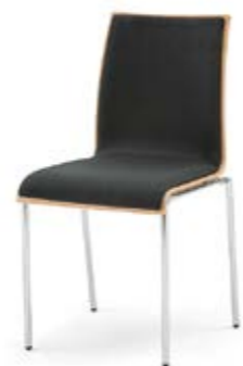
Modell 3023: Buche natur, Polsterdoppel