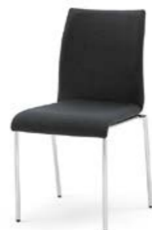
Modell 3024: Vollpolster