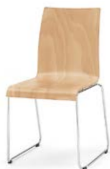
Modell 3030: Buche natur, ungepolstert