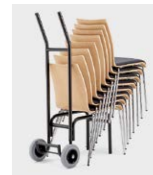
Modell 1036: Stuhlkarre