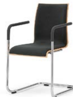
Modell 3043/A: Buche natur, Polsterdoppel