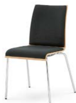
Modell 3012: Buche natur, Sitz- und Rückenpolster