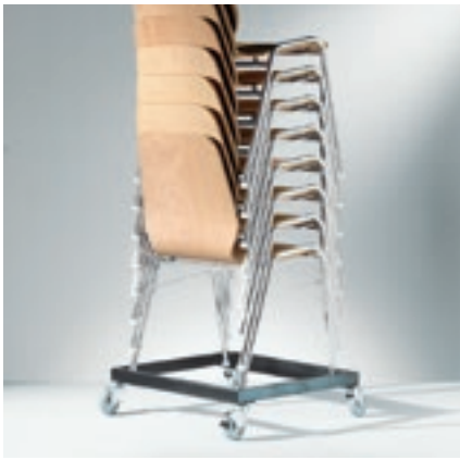
Modell 1039, Transportwagen