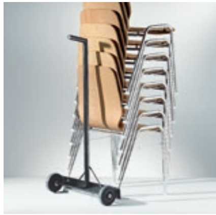
Modell 1037, Transportkarre