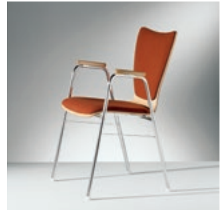
Modell 2030-1, mit Armauflagen Schichtholz, Sitzschale mit Sitz- und Rückenpolster