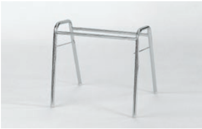
Gestell 1: Rundrohr Ø 20 x 1,5 mm