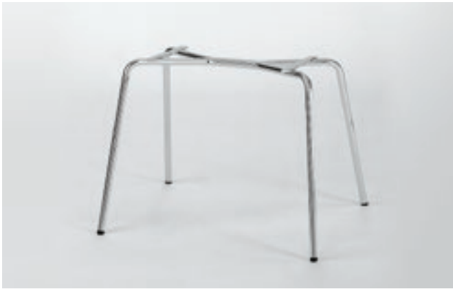
Gestell 4: Rundrohr Ø 18 x 2 mm