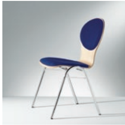
Modell 2034-2, Sitzschale mit Sitz- und Rückenpolster