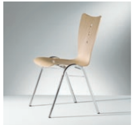
Modell 2032-2, Sitzschale Buche natur