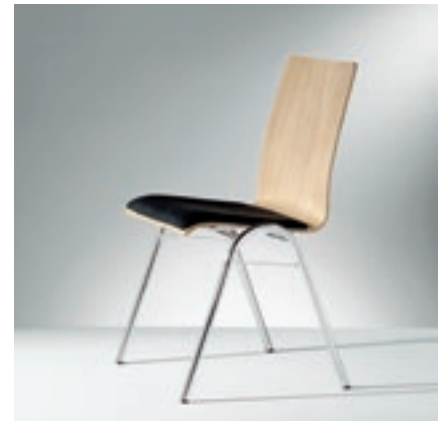
Modell 2036-2, Sitzschale mit Sitzpolster