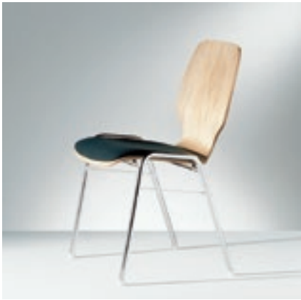
Modell 2023-1, Sitzschale mit Sitzpolster