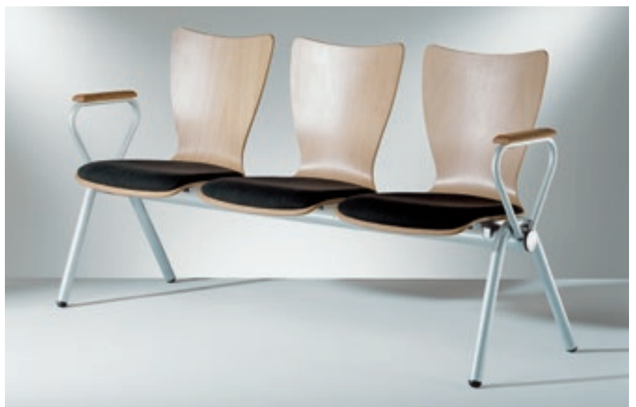
Modell 2030/2-3, Sitzbank mit Holzarmauflagen