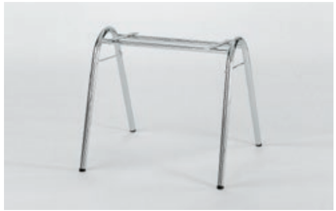
Gestell 2: Rundrohr Ø 22 x 2 mm