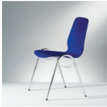
Modell 2022-2, Sitzschale blau gebeizt