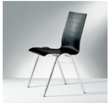
Modell 2038-2, Sitzschale schwarz gebeizt

Sitzschalen aus Buchenformsperrholz natur lackiert oder gebeizt und lackiert, verschiedene Rückenausfräsungen, wahlweise mit Sitz- und Rückenpolster. Unterschiedliche Gestelle stehen zur Auswahl mit und ohne Armlehnen.