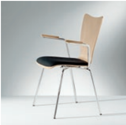
Modell 2030-4, mit Armauflagen Schichtholz, Sitzschale mit Sitzpolster