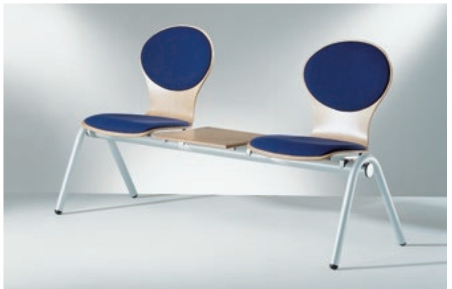
Modell 2034/2-7, Sitzbank