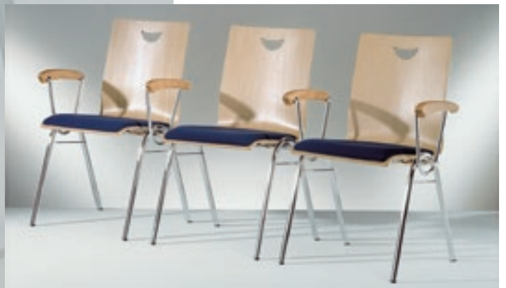
Modell 2036-2, Sitzschale mit Griffloch und Sitzpolster, im Wechsel AL-Stuhl, Stuhl, AL-Stuhl, fest verbunden