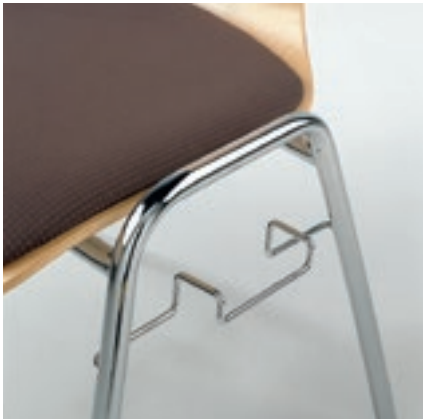
Gestell 1 Reihenverbindung