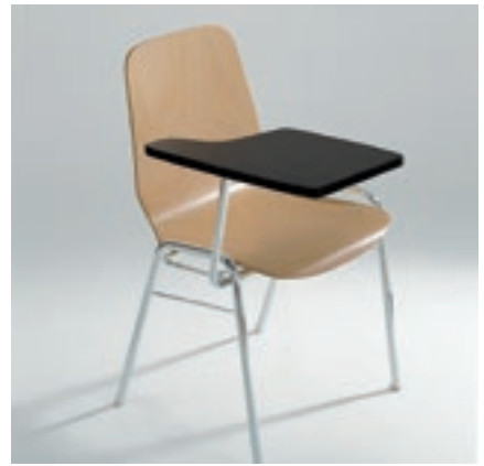
Modell 2022-1, ansteckbare Schreibplatte, hochklappbar