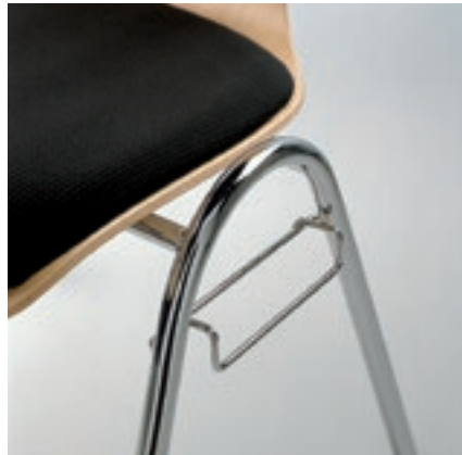
Gestell 2 Reihenverbindung