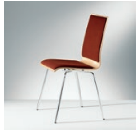
Modell 2036-4, Sitzschale mit Sitz- und Rückenpolster