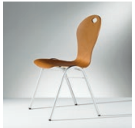
Modell 2034-2, Sitzschale mit Griffloch, kirschbaumfarbig gebeizt