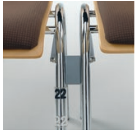
Einhänge-RV als Buchablage, Reihennummerierung