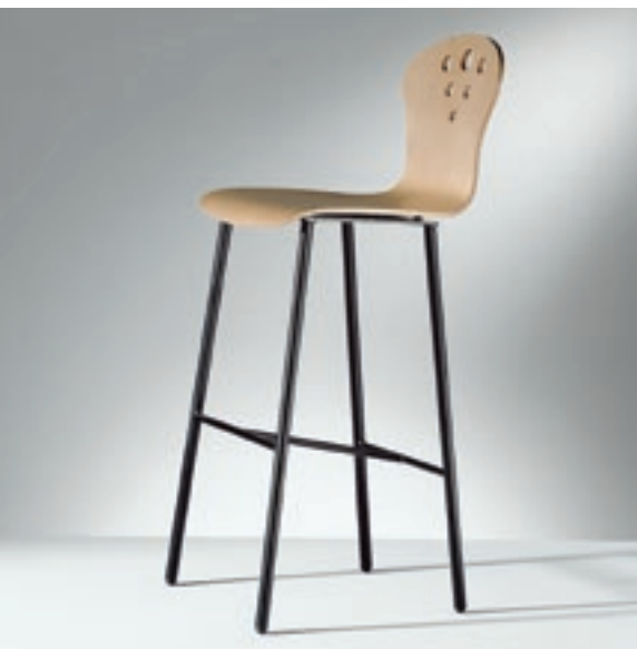
Modell 2047, Hocker