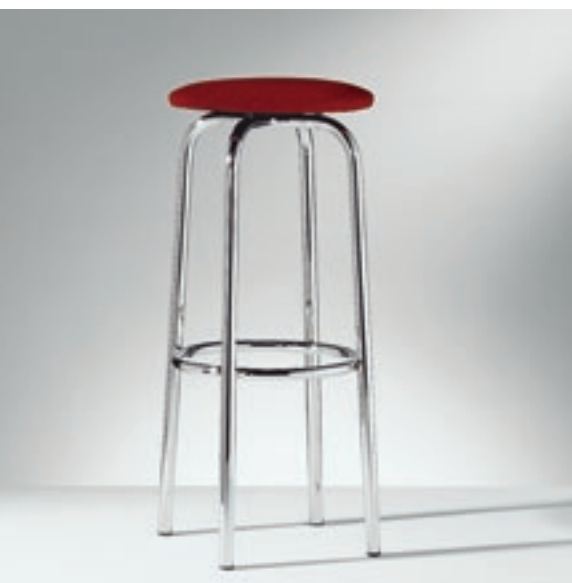
Modell 2046, Hocker