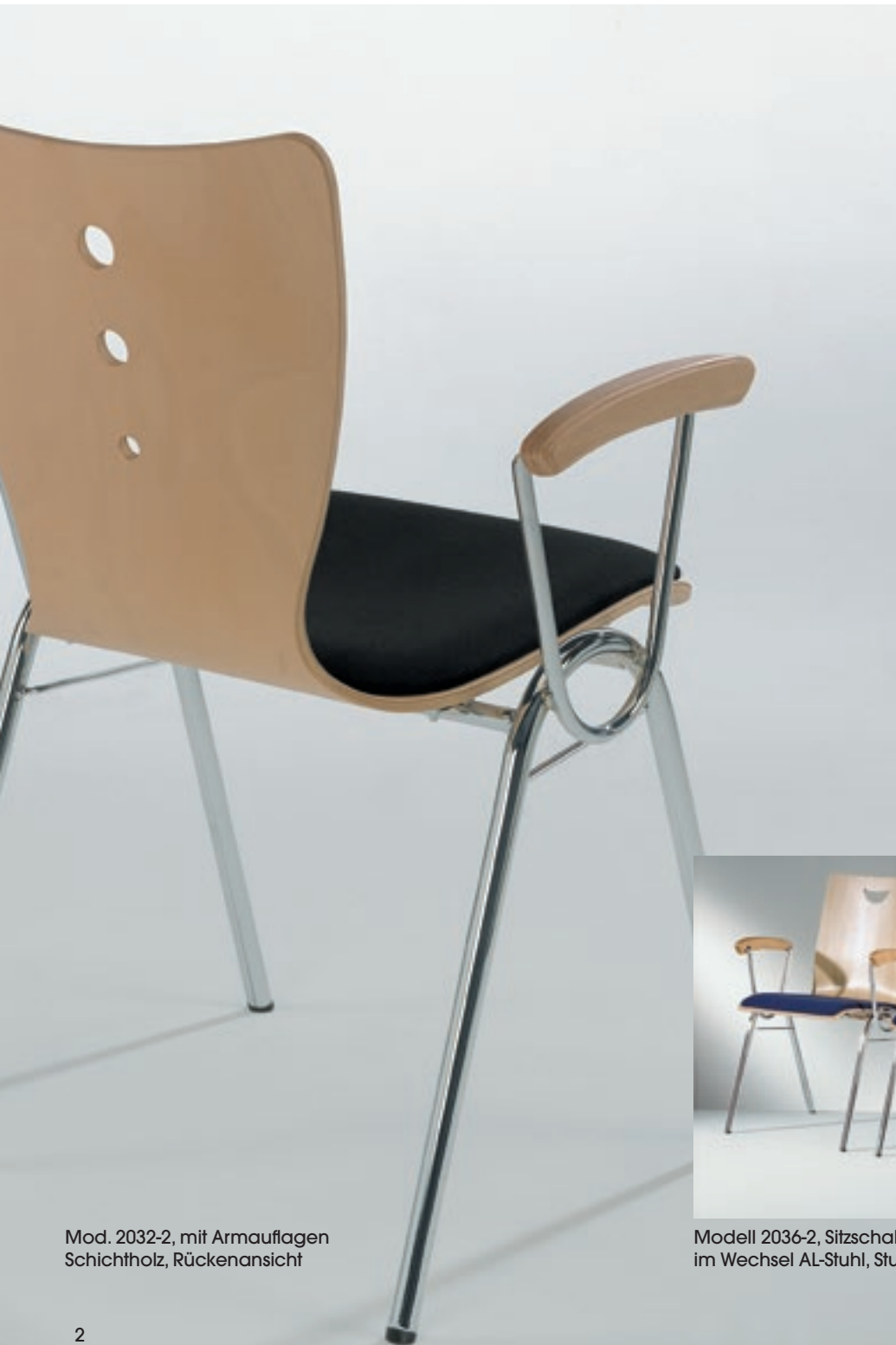
Mod. 2032-2, mit Armauflagen Schichtholz, Rückenansicht