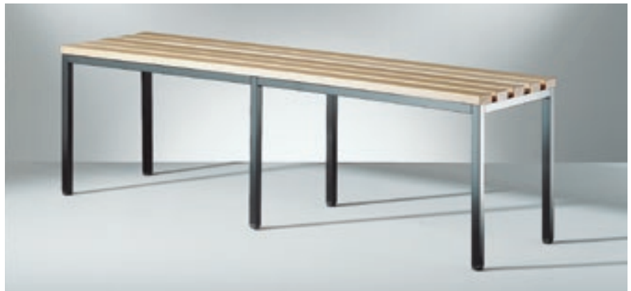
Modell 2094, Sitzbank