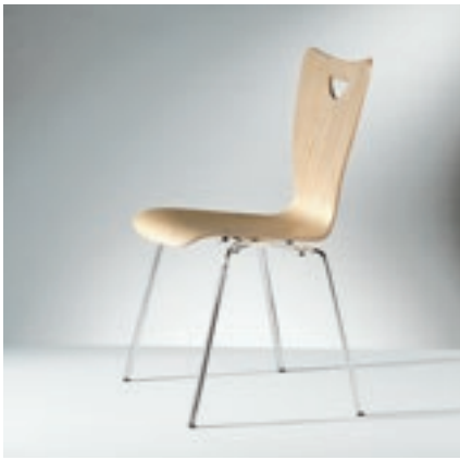
Modell 2030-4, Sitzschale mit Griffloch