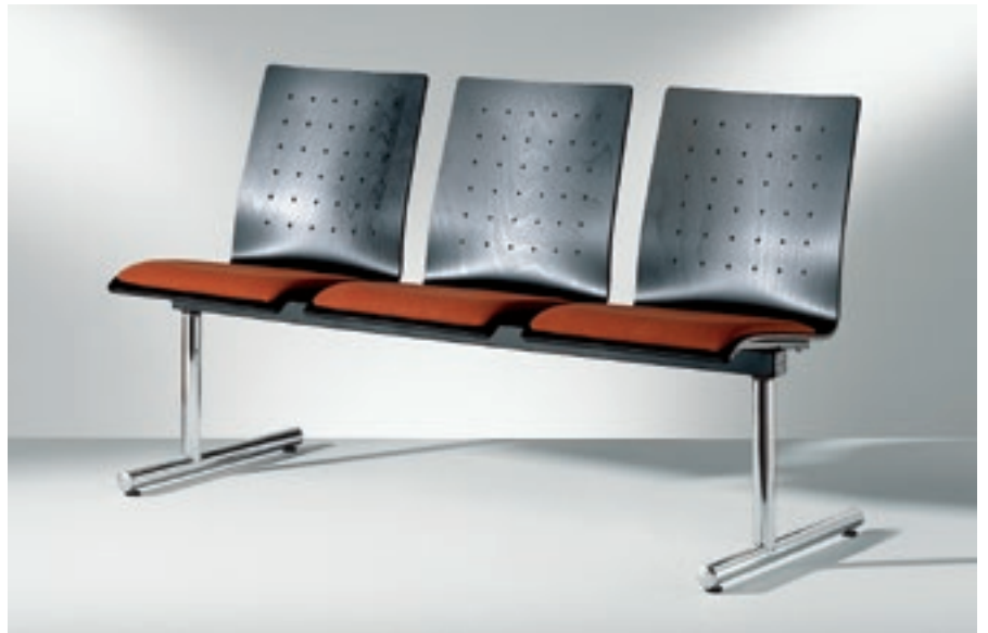
Modell 2038/1-3, Sitzbank

Traversenbänke, Lösungen für Warteräume und Foyers