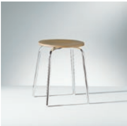
Modell 2045, Hocker