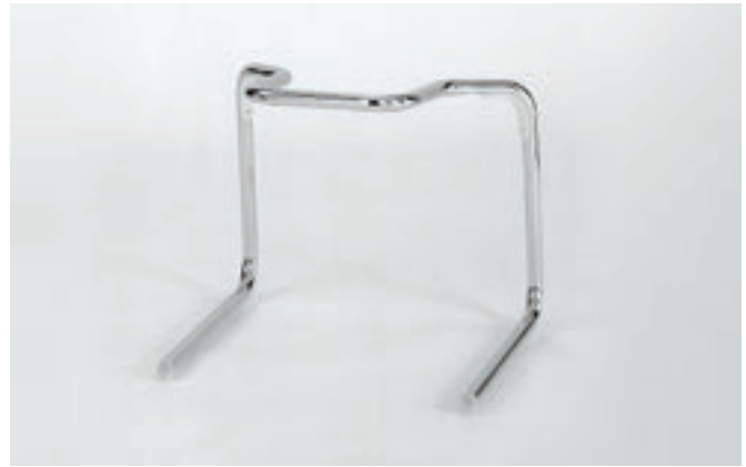
Gestell 5: Rundrohr Ø 25 x 2 mm mit Kantenschutz und Stapelpuffern