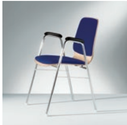
Modell 2022-1, mit Armauflagen Integralschaum schwarz, Sitzschale mit Sitz- und Rückenpolster