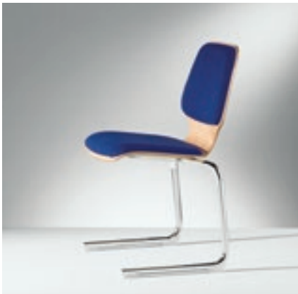
Modell 2023-5, Sitzschale mit Sitz- und Rückenpolster

Stapelbare Form-Schalenstühle in verschiedenen Modell-Varianten